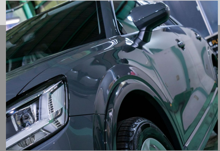
深みのある光沢感