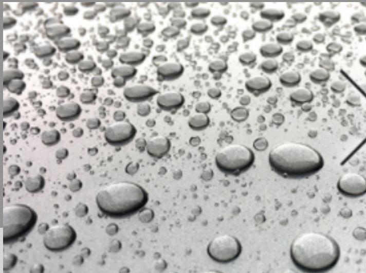
優れた撥水性・疎水性