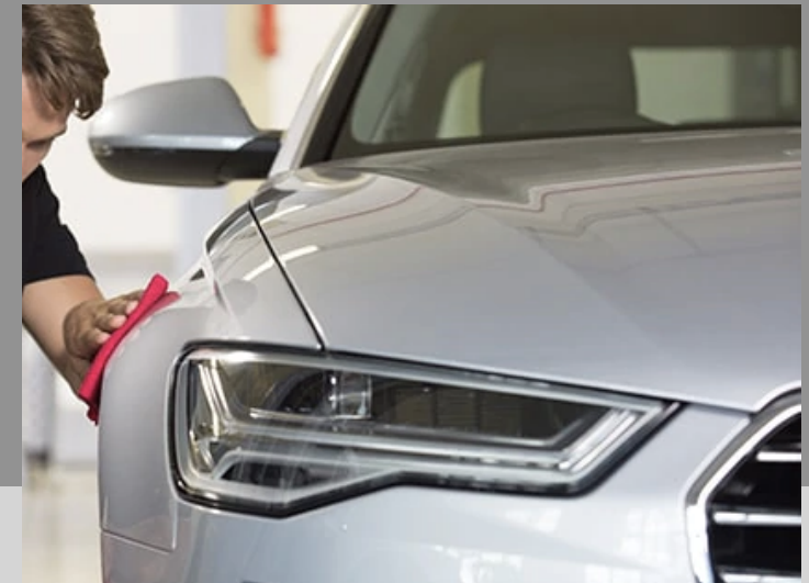
簡単メンテナンス